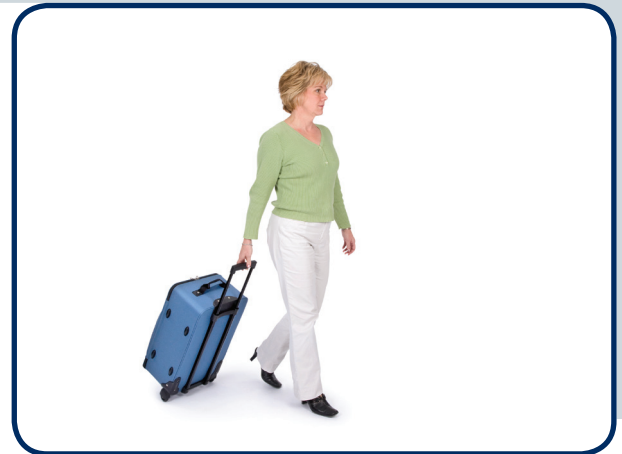
TITMUS V3 Rollenkoffer

Das Sehtestgerät TITMUS V3 überzeugt auch im harten Praxiseinsatz durch seinen robusten Aufbau und seine besondere Zuverlässigkeit.