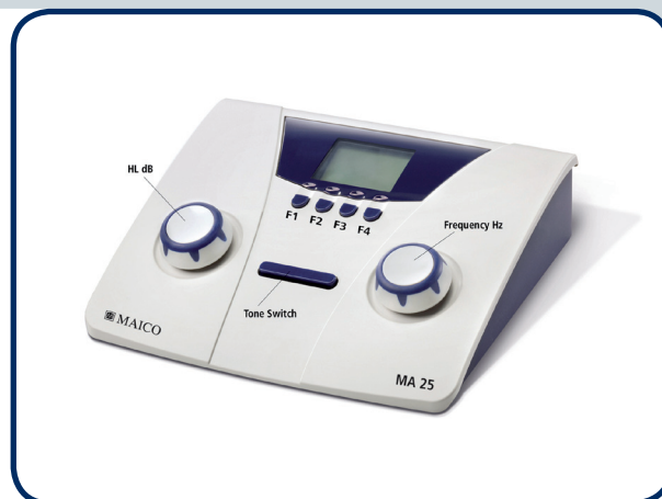
MA 25 Funktionstasten